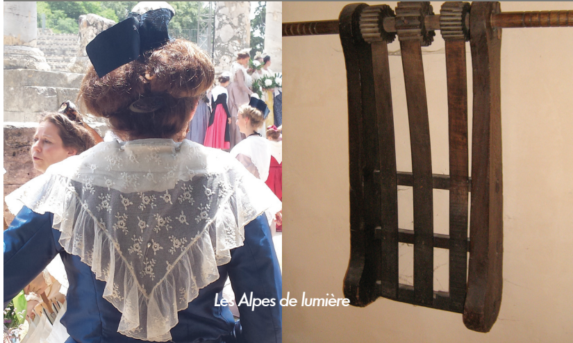
Les Alpes de lumière

La langue d'oc telle qu'on la parle Atlas linguistique de la Provence